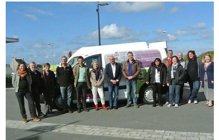
KUZUL KER, Yaou 3 viz meurzh Conseil municipal, jeudi 3 mars 2016